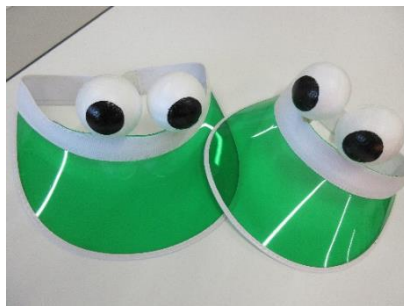
「二見かえる」を踊る際にかぶるカエルのサンバイザー