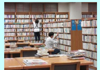
昨年の特別整理期間の様子