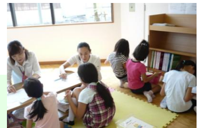
昨年の調べ学習講座の様子