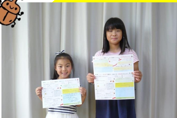
★辞典の使い方ならおまかせ!