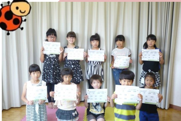
★みんなで分類について学びました!